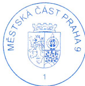
Mgr. Tomáš Portlík starosta

dne 14.5.2024 od 8:30 hodin dne 14.5.2024 od 12:30 hodin dne 15.5.2024 od 8:30 hodin dne 15.5.2024 od 12:30 hodin dne 15.5.2024 od 15:30 hodin