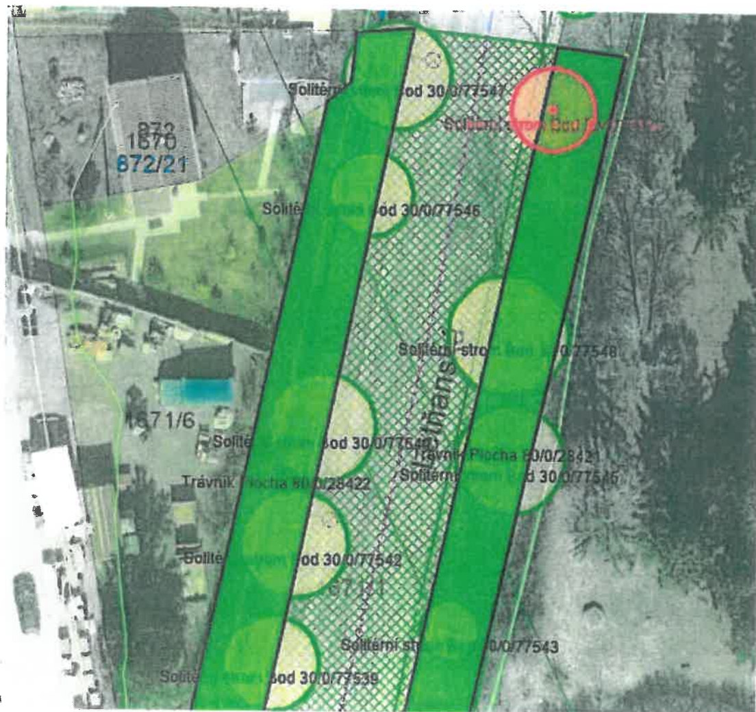
Obr. č. 6: Situační plánek Ulice Letňanská – ID stromu 77550