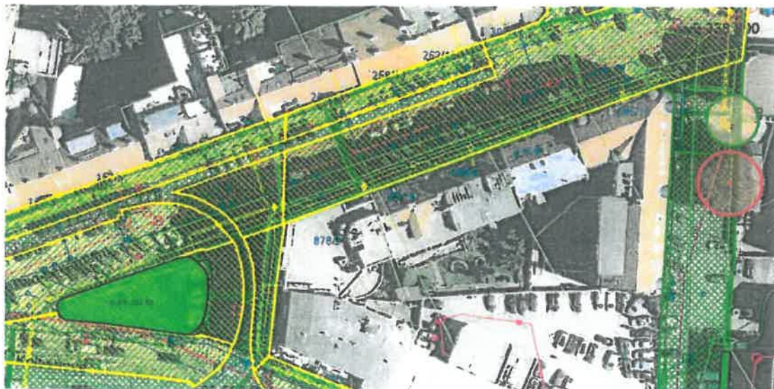
Obr. č. 2: Situační plánek Ulice Pod Pekárkami – ID stromu -1699274298