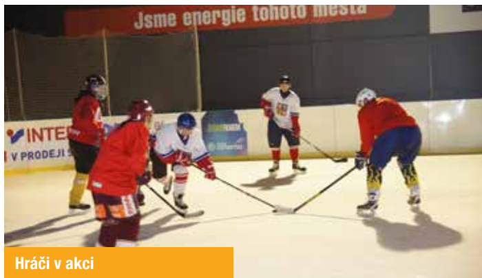
Hráči v akci

Ledová plocha na střeše Galerie Harfa se 5. března 2014 stala dějištěm přátelského hokejového utkání představitelů MČ Praha 9 a společnosti Lighthouse Group, která je developerem projektů Galerie Harfa, Harfa Office Park nebo třeba rezidenčního bydlení Zelené Město.