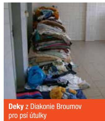
Deky z Diakonie Broumov pro psí útulky