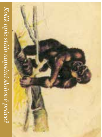
Kolik opic stálo napsání slohové práce?