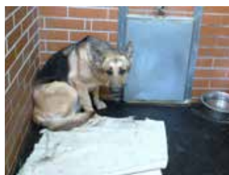
V útulcích jsou deky velmi potřebné

mov předala do útulku v Troji na konci února a obě strany se dohodly na dlouhodobé spolupráci. Se zástupci Diakonie Broumov a útulků pro opuštěná zvířata v Troji a Dolních Měcholucech se můžete setkat na akci Den Země – Mikroklima 2014, kterou pořádá Městská část Praha 9 dne 15. května 2014 v Parku přátelství na Proseku. Podrobnější informace o akcích naleznete i na webových stránkách Městské části Praha 9 www.praha9.cz/mikroklima1.html .