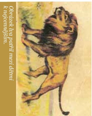
Obrázek lva patřil mezi dětmi k nejcennějším.

a učebnice nestačily všechno obsáhnout, byly stručné a nezadaly se nám tak zajímavě. To chápali i naši učitelé a tolerovali, když nás přistihli při přestávkovém korigování chodbou školy se štěstěm těchto obrázků.