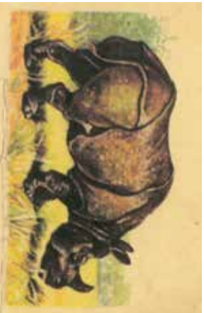
Velkou směnnou hodnotu měl i nosorožec.