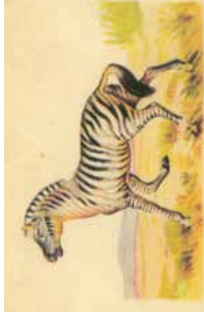
Obrázky se zvířátky „koukaly“ z krabíček na mýdlo.

Jako pamětník mám nejen právo, ale i povinnost vzpomínat a své vzpomínky chránit před zapomenutím. Proto se na stránkách Rokytky objevují i prožitky dětí od poloviny třicátých let 20. století.