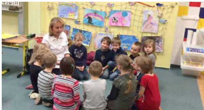
Přípravná třída ZŠ Litvínovská 600

„Ve třídě mám 15 žáčků, kteří sem byli zařazeni většinou pro klasickou školní nezralost, takže potře-