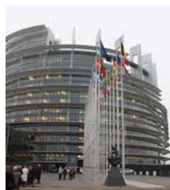
Kulatý tvar sídla Parlamentu symbolizuje jeho otevřenost

Občané jiných členských států EU v případě, že budou chtít využít práva hlasovat v České republice a jsou přihlášení nejméně od 9. 4.