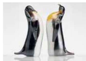
Václav Jaroš: Tučňáci