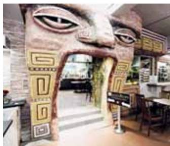
Choco-Story Muzeum čokolády Praha

V Muzeu čokolády si můžete i něco vyrobit a odnést s sebou. Prohlídky jsou určeny pro skupiny po 20 osobách. Čas prohlídek: v 11.00, 11.30 a 13.00 hodin. Sraz v Praze 1, Celetná 10, deset minut před začátkem akce. Vstup pro seniory z MČ Praha 9 je za zvýhodněných 100 Kč, které je nutno zaplatit do konce ledna v Galerii 9, přízemí staré budovy radnice, Sokolovská 14, Praha 9. Bližší