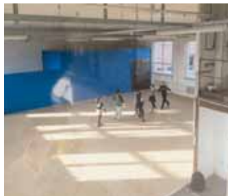
Sál Emil v hale č. 19 t

„Byl to pro nás ideální prostor, o jakém jsme snili od roku 2005, kdy Collegium 1704 vzniklo. Už jsme se dál nechtěli stěhovat po zkušebnách, kterých pro nás v Praze není mnoho. Potřebujeme velké prostory, protože na našich projektech se běžně podílí 25–35 lidí v orchestru a kolem