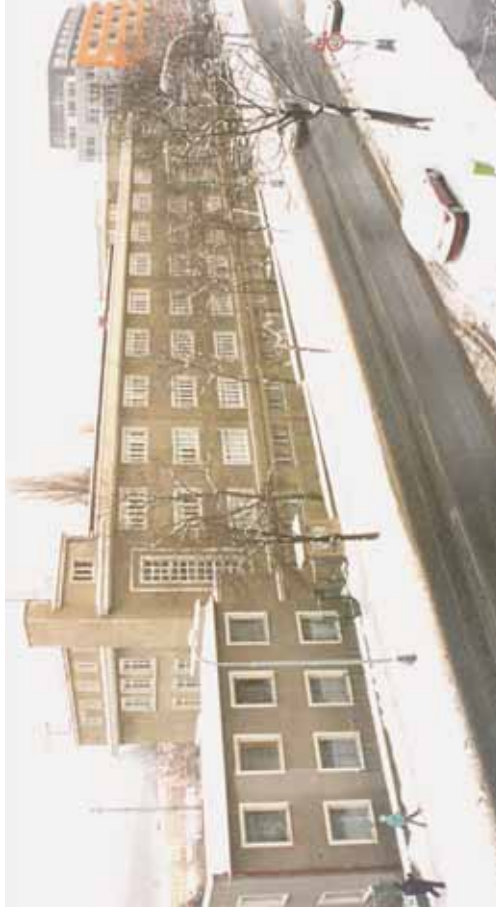
Novousočanská ulice, objekt bývalé nocležárny hlavního města Prahy. Nymt střední odborné učiliště.