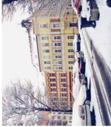
Průhled z Krátkého ulice na Zbukvou. Dvojice z několika domů, které byly pro svou stavební hodnotu uchráněny velkoplošné demolice přednádražního prostoru.