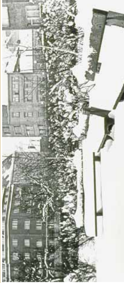
Skrýtý průhled do Jandovy ulice z parku na dnešním náměstí OSN. Dnes je tu místo lavíček plujících sněhu stanice metra.