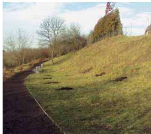
První lednový den po nich zbyly jen díry v zemi