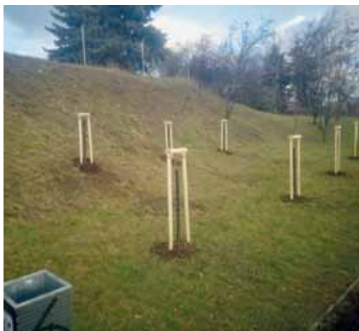
Ještě 29. 12. 2017 rostly hrušně podél naučné stezky Amerika

Městská část Praha 9 se snaží veřejnosti postupně otevřít výjimečnou přírodní památku – Prosecké skály. V první etapě prací v roce 2016 revitalizovala zanedbané a nevyužívané plochy po bývalé zahrádkářské kolonii. To zahrnovalo vybudování vyhlídkové terasy se zázemím, úpravu vstupního prostoru včetně vybudování komunikací a zpevněných ploch, 12 parkovacích stání, nového chodníku, chodníkového přejezdu a nového přechodu pro chodce při ulici Na Vyhlídce, vybudování nových přípojek technické infrastruktury (elektrina, voda, kanalizace), vybudování pěší vyhlídkové trasy po hraně proseckých skal směrem k ulici Nad Kunderatkou jako rozšíření stávající naučné stezky městské části (I. severozápadní vlastivědná stezka), parkové, sadové a zahradnické úpravy území.