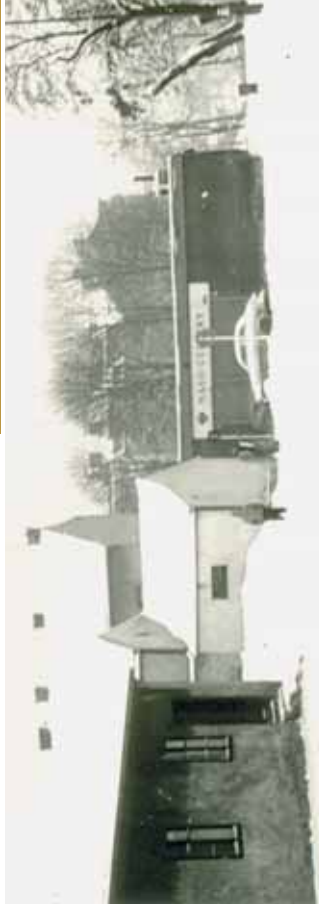
Křížovatka ulic Parškovy a Zbukvovy. A zase připomínka minulosti: Parškovou ulici procházela hranice mezi územím Vysočan a Libně. Část ulice směřem k pochodu nádraží k Libni, dolní část směřující k dnešní Sokolovské, byla jako součást vysočanského katastru označena názvem Riegrnova. Jedna ulice s dvěma „vlastníky“ a dvěma jmény.