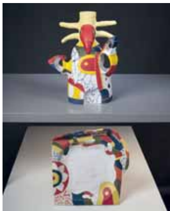
Dana Nováková: Lampa

... absolvovala na Pedagogické fakultě UK. V roce 1984 nastoupila na výtvarný obor lidové školy umění, kam chodila jako žačka k ak. mal. Haně Urbanové. Po mateřské dovolené se vrátila do Základní umělecké školy na Proseku. Od ukončení studia na pedagogické fakultě se věnuje keramické