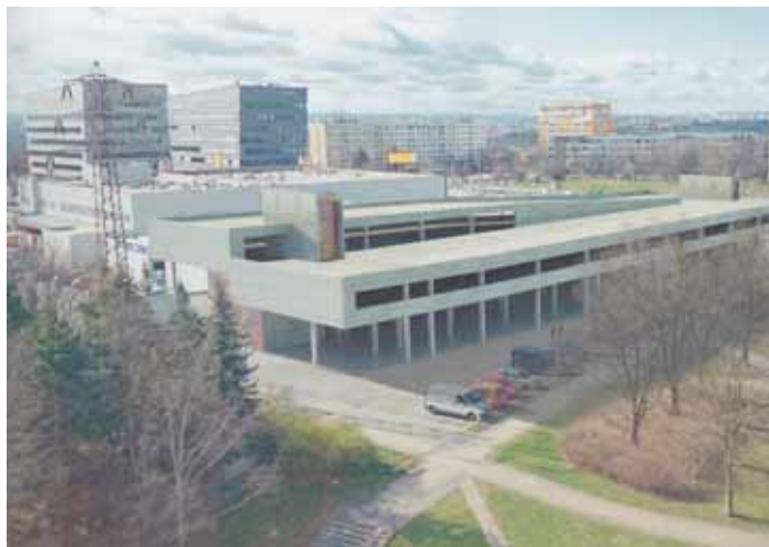
Takto by měl vypadat nový parkovací dům u Billy na Proseku.