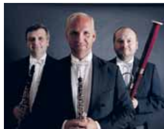
Pražské dechové trio

Cyklus koncertů komorní hudby pokračuje na vysočanské radnici 22. února od 19 hodin koncertem Pražského dechového tria.