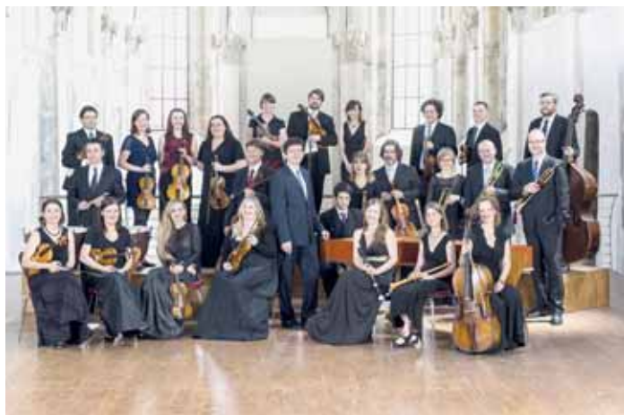
Collegium 1704 a Collegium Vocale 1704 v jednom ze svých projektů