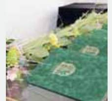
Čestná cena městské části Prahy 9