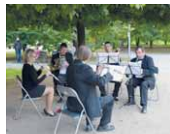
Prosecká zastavenička v Parku Přátelství

„Na začátku jsme stáli před otázkou, co hrát. Nechtěli jsme zůstat jen u klasiky jako v případě Proseckých zastaveniček,