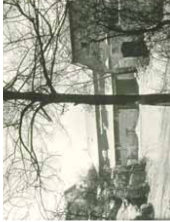
Usedlost Flašnerka z doby počínající devastace. Dnes z ní zbylo jen znovuzřízené obytné stavení. Znalci vědí, že dnešní objekt je postaven v osmdesátých letech 19. století, když původní stáoba musela ustoupit výstavbě náspu železniční trati. Pouze původní arkýř byl rozebrán a zasazen do nové stavby.