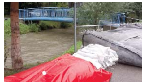
Připraveni na velkou vodu

Na ochranu před velkou vodou bylo dále připraveno na 500 pytlů s pískem, které navázeli pracovníci Hortusu-správa zeleně. Ti také už po prvních varováních meteorologů kontrolovali a čistili odtoky vodotečí v parcích a odtoky u cest a kana-