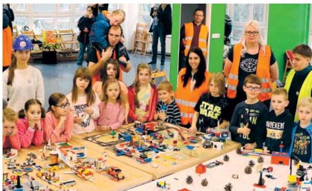
Lego-párty se těšila velkému zájmu dětí

„Abychom nezůstávali v zajatých kolejích, zajímá nás, čím bychom na Proseku mohli být užiteční. Proto v říjnu v okolí