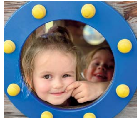
V novém školním roce kromě dětské skupiny Klubík v přírodě navštěvují děti i nový Klubík u Rokytky