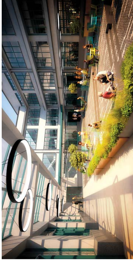
Pragovka nabízí prostor pro setkávání, odpočinek, nakupování i zážitky – nabídně koncerty, projekce, kavárny, skatepark, vnitřní i venkovní akce, nakupování, gastronomie...

než se začala dávat dohromady, už měla poměrně dlouhou a velmi zajímavou dramaturgii. Konaly se tam výstavy, v provozu byla kavárna, setkávali se tam mladí lidé, působili v ní umělci, byl to takový neformální umělecký hub. To se nám líbilo. Za druhé krásně zapadla do našeho portfolia mezinárodních staveb. Dělalí jsme projekt Bílé lázně jako obchodního paláce, Elektrických podniků jako administrativního paláce, Volmanovy vily jako nadstandardního rezidenčního domu. To vše industriální objekt Pragovky, který tehdy vznikl zcela účelově jako centrální sklad pro ministerstvo pošt a telegrafii, nádherně doplnil. Byl to další korálek do náhrdelníku architektury první republiky, která nás jako atelier i mě osobně mimořádně zajímá.