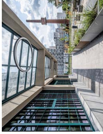
... a v novém kabátu

zmiňované skupiny kolegů. Sledovali jsme, co se s objektem dělo, když továrnu zabavili Němci, když se sem po válce vrátila výroba legendárních automobilů ČKD, největšího strojírenského podniku v tehdejší Československu. Pragovka v podstatě zmapovala 80letou historii průmyslové výroby ve Vysočanech, proto nás začala bavit ještě víc a baví dodnes.