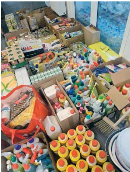
Do sbírky potřebných věcí se zapojila i ZŠ Novoborská

Správa služeb hl. m. Prahy tak dopravila na Bruntálsko 30 elektrických vysoušečů, dezinfekční a úklidové prostředky včetně stavebních koleček a lopat. Do pomoci Zátoru a Brantic se zapojil rovněž Hasičský záchranný sbor hl. m. Prahy. Zapůjčil 6 elektrocentrál a 6 kalových čerpadel s hadicemi.