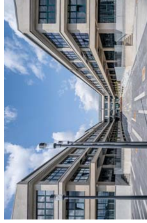
Díky kanceláři TaK Architects dostala Pragovka novou šanci

Za první republiky byla ekonomika velmi silná, i když země procházela hospodářskou krizí. To vedlo ve stavebnictví k vysoké míře efektivity a třibení řemesla. Navzdory tomu,