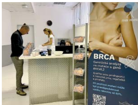
Odběrové místo programu Strom prevence na Poliklinice Prosek. Stačí se objednat a pak jen otevřít ústa...

Celý program Strom prevence je koncipován tak, že v průběhu roku bude postupně představeno devět vyšetření, na která se budou moci lidé z deváté městské části přihlásit. V říjnu se vyšetření zaměří na prevenci rakoviny prsu, vaječnicku a prostaty. V listopadu a prosinci bude v hledáčku genetiků zjišťování genetické predispozice ke zvýšené srážlivosti krve. Ta zvyšuje riziko vzniku trombózy a následných možných – i velmi závažných – komplikací, jako je například embolie.