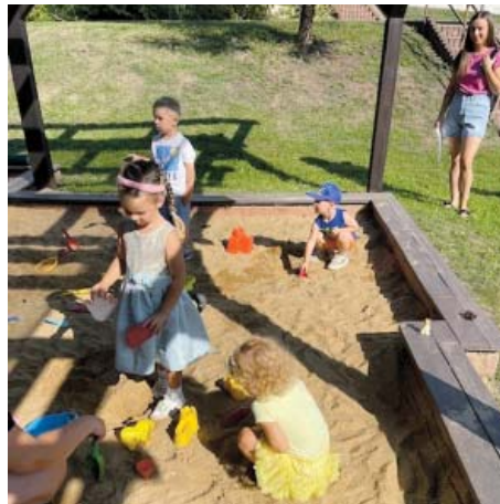
Školka nanečisto, to bylo srpnové adaptační dopoledne Pod Krocínkou