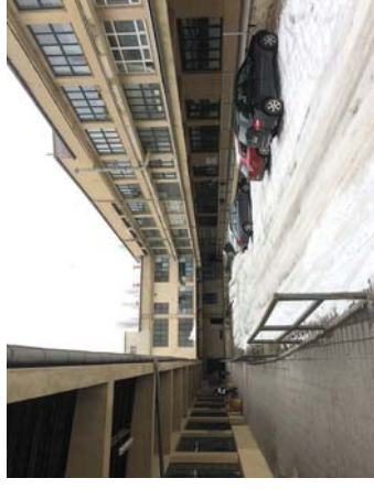
Budova E před rekonstrukcí ...

že stavba vznikla jako ryze účelová a byla rychle hotová, měla i po těch letech vynikající kvalitu. Bylo to pro nás překvapivé mimo jiné proto, že jsme zde pracovali s budovou běžné výstavby, která nebyla typicky autor-ská, nevyšla z tužky věhlasného architekta a ani se nejednalo o sledovanou nebo jinak společensky významnou zakázku, šlo o průmyslový sklad s doplňkovou výrobou a administrativní nástavbou.