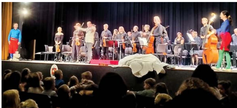
Děti z MŠ Novoborská na koncertu Prague Philharmonia

▲ Text a foto: Markéta Pokorná, MŠ Novoborská