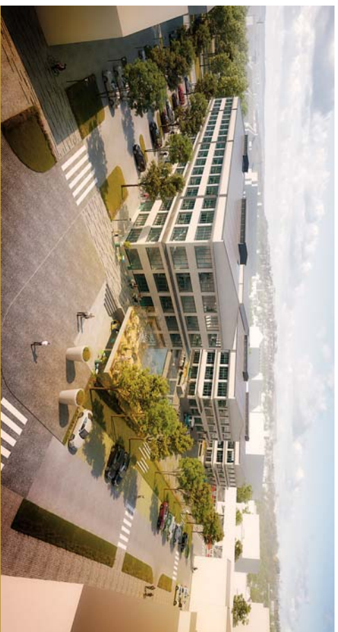
Pragovka je novým typem městského prostoru světového formátu. Místo, které je hrdé na svou minulost a zároveň plně inovace, podnikavosti a kreativity.