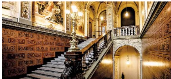
Seniři z Harrachovské vyrazí 14. února na prohlídku historické budovy Muzea UMPRUM

Zdravotní cvičení pro seniory, zdarma, sál Knoflík, Jablonecká 723/4 7:50 – 8:50 Němčina pro pokročilé 9:30 – 10:30 Angličtina se Zuzkou pro začátečníky, lekce 50 Kč 9:00 – 10:00 Angličtina se Zuzkou pro mírně pokročilé, lekce 50 Kč 10:00 – 11:00 Klub seniorů – kardiaků (schůze) 14:00 – 16:00