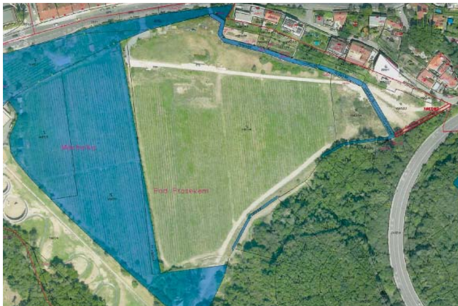
▲mk Prosek a Vysočany spojí tzv. viniční stezka

Cesta povede i kolem „znovuobjeveného“ pramene, jenž byl zmiňován v dávných dobách jako Kellerka, nacházel se pod stejnojmennou usedlostí a vyvěral ve vinohradu.