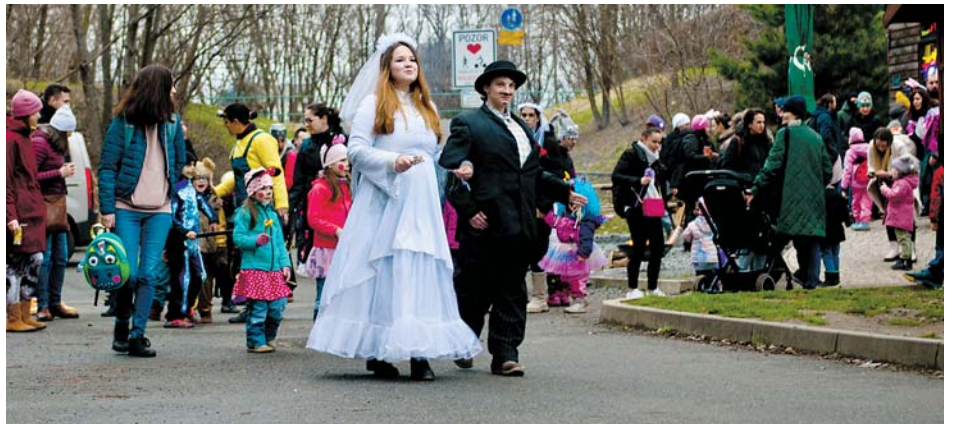
Pozor, masopust na Vysočanech bude už 11. února. Chystejte masky!

Březen je ideálním měsícem k oslavě knih a čtení. V Edu Bubo Klubu připravují řadu aktivit, které podpoří lásku k literatuře