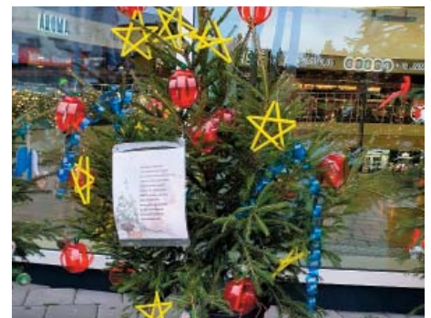
Vítězný vánoční stromek ozdobily děti z MŠ Pod Krocínkou