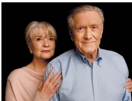
Carmen Mayerová a Petr Kostka se představí v Divadle Gong 11. února 2025

Uslyšíte, na které své filmové, televizní a divadelní role oba populární herci vzpomínají nejraději, na které slavné kolegyně nemohou zapomenout, co před lety na začátku jejich kariéry rozhodlo, že se dali právě na herectví, v čem v současnosti hrají a co je na umělecké práci baví i dnes. A také co je svedlo dohromady coby životní partnery, díky čemu jejich vztah vydržel tolik