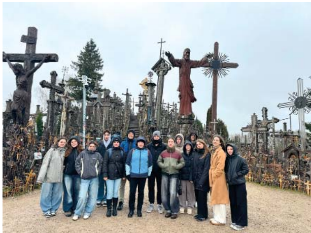
Studenti Gymnázia Českolipská v Litvě

Erasmus+ je program EU na podporu vzdělávání, odborné přípravy, mládeže a sportu v Evropě. Program na období 2021–2027 klade silný důraz na otázky sociálního začleňování, na zelenou a digitální transformaci a podporu účasti mladých lidí na demokratickém procesu. Aktivně se do něho zapojuje i Gymnázium Českolipská z Prahy 9.