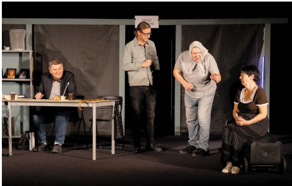
Zabíla jsem Karla, divadelní hra spolku Post Scriptum, je k vidění v Divadle Gong ještě 11. února 2025