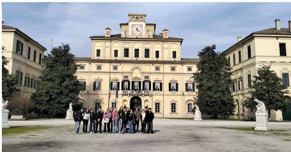
Před třemi měsíci navštívili studenti z Českolipské italskou Parmu, v březnu naopak přivítají své italské kamarády v Praze