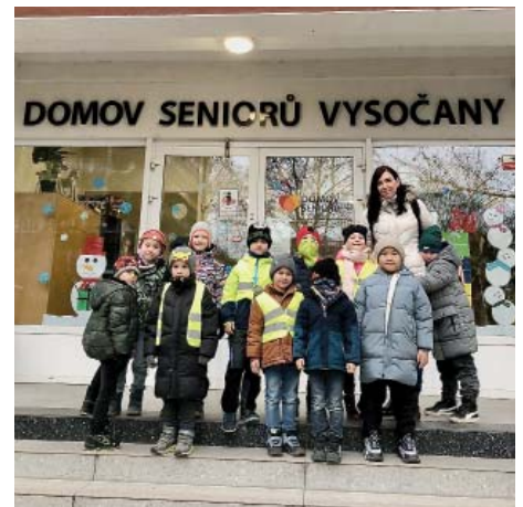
Děti z Elektry mezi seniory domova ve Vysočanech

Text a foto: Lenka Levá ze ZŠ a MŠ Elektra