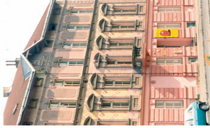
Kneippovy lázně v Prosecké ulici v Libní

konce vybudoval v Jeseníku, tehdy v Grafenberku, ústav pro léčení studenou vodou.