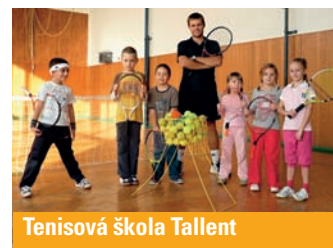
Tenisová škola Tallent

Kromě tenisových kurzů jsme pro všechny dívky a kluky bez ohledu na věk, ale i celé rodiny, připravili program na celé léto v podobě příměstských táborů, tenisových táborů a campů. Např. tenis a moře,