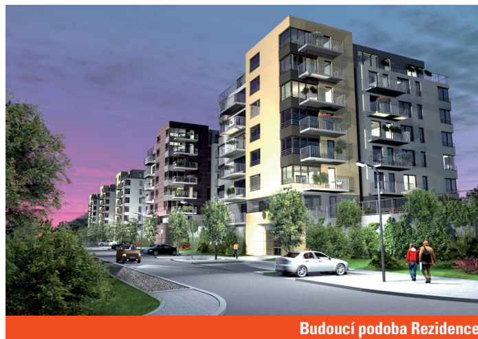
Budoucí podoba Rezidence