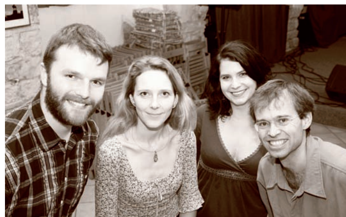
Vokální skupina Pětník

Pětník kromě několika kratších nahrávek z let 2002 – 2010 vydal debutové album V botách snů (Good Day Records, 2004) a v těchto dnech mu pod značkou agentury Speed of Sound vychází druhé album s „11“ na přebalu. Číslo naráží nejen na počet let existence skupiny a rok vydání, ale