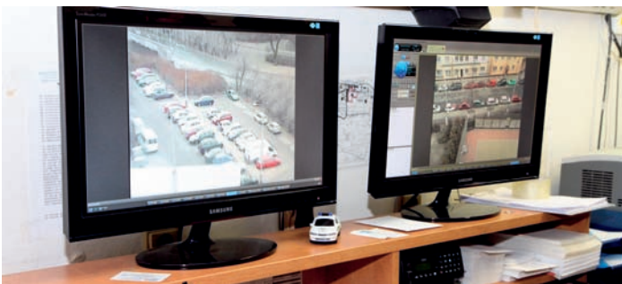
„Devítkové“ kamery jsou napojeny na dohledové centrum Místního oddělení Policie ČR Vysočany

V současné době funguje devět kamer – na základě bezdrátového přenosu pomocí wi-fi zařízení – které hlídají místa, kde dochází k trestné činnosti nejčastěji. Patří mezi ně například okolí Základní školy Špitálská a ZŠ Na Balabence, Nemocniční ulice, ulice Kurta Konráda, Prouzova, Poštovská, Kovanecká, U Školičky a jejich přilehlé okolí. V Praze 9 dosud fungoval pouze kamerový systém města, který však sleduje především hlavní tahy. Nyní tedy jsou pod kontrolou také menší ulice ve Vysočanech.