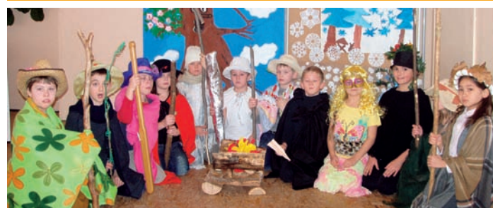
Malí herci se představili v pohádce O dvanácti měsíčkách

bivé a nechají se podnětným prostředím podchytit k mnoha zajímavým činnostem a aktivitám.