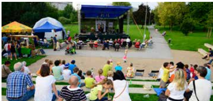
Takto to vypadalo při Golden 9 – Zlaté Devítce loni

Park Přátelství opět ožije swingovou taneční muzikou, a to v rámci 3. ročníku mezinárodního jazzového festivalu Golden 9 – Zlatá Devítka.