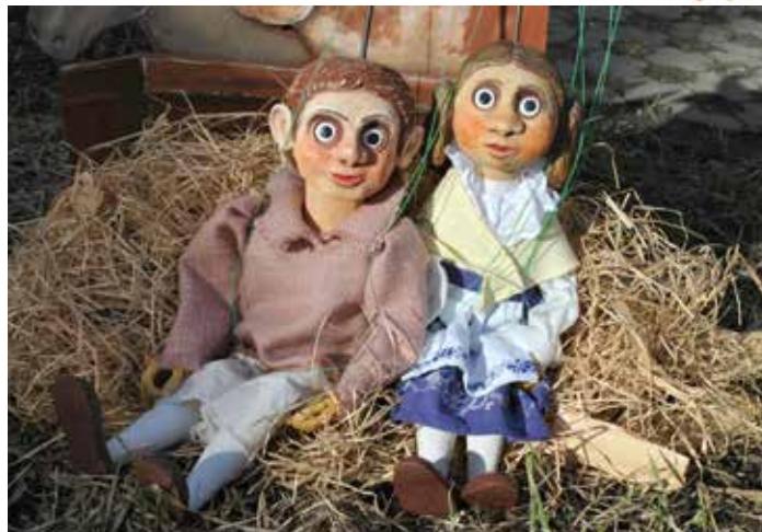
Loutky ze Svátova divadla