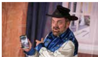
Hledám milence, zn. spěchá

26. 8. 2015 20:00 (St) Táta 27. 8. 2015 20:00 (Čt) Decibely lásky Více informací na www.divadloartur.cz