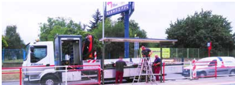
Větší pohodlí i bezpečí poskytují zastávky umístěné přímo na tramvajových ostrůvcích

Zastávku na stanici U Elektry přemístila společnost JCDecaux. Další by měly následovat. < red