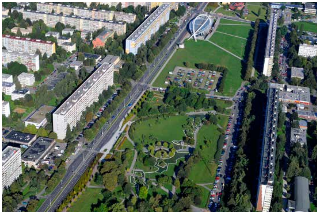
Cestou, jak zabránit dalšímu zahušťování výstavby na Proseku, je získat pozemky do vlastnictví MČ Praha 9

Konkrétně se jedná o pozemky v Hloubětíně v oblasti tzv. Číny o celkové výměře 18 352 m 2 a pozemky ve Vysočanech v lokalitě na Krejčárku o výměře 8170 m 2 , a to minimálně za cenu obvyklou. Obě lokality jsou určeny pro komerční