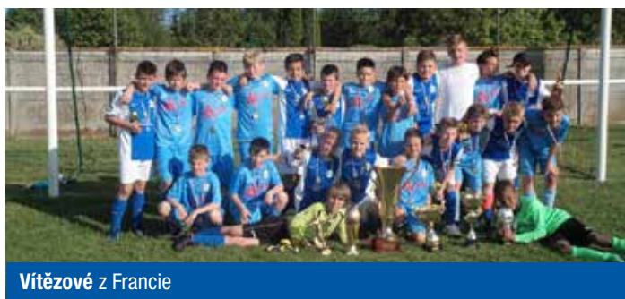
Vítězové z Francie

Za loňskou sezonou se musí udělat hodně tlustá čára a začít znovu. A co očekávám? Rozhodně nechci říkat dopředu, že bychom chtěli být do pátého či osmého místa. Musíme se soustředit na každé utkání a jít od zápasu k zápasu.