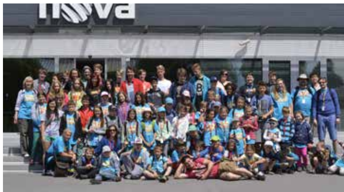
Děti navštívily studia TV Nova

L etos se mládežníci i děti vypravili do filmového světa Hollywoodu. Pestrý program jim nabídl řadu tematických workshopů, jako je psaní scénáře, natáčení vlastního videoklipu, editace videa, menší děti uvítaly náplň v podobě dramatického a tanečního workshopu či her. Většina