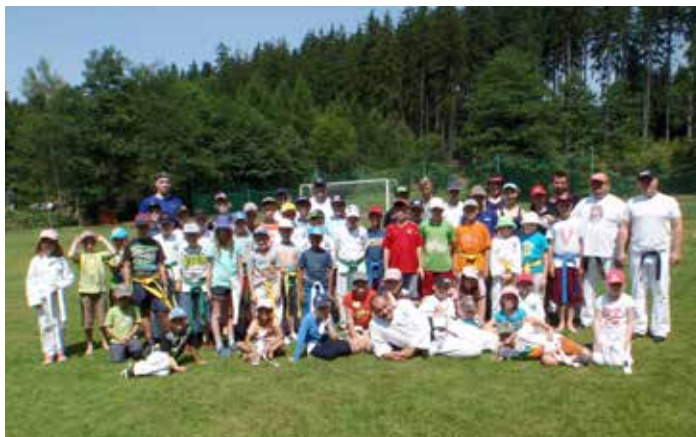
Z letního tábora proseckých taekwondistů

První turnus byl otevřen, tak jako v minulých letech, nejenom členům oddílů, ale i široké veřejnosti. Členové cvičili jedenkrát denně v dopoledních hodinách taekwon-do. Nečlenové si mohli vybrat, kterému sportu se budou věnovat. Většina z nich však chtěla trénovat základy taekwon-da.