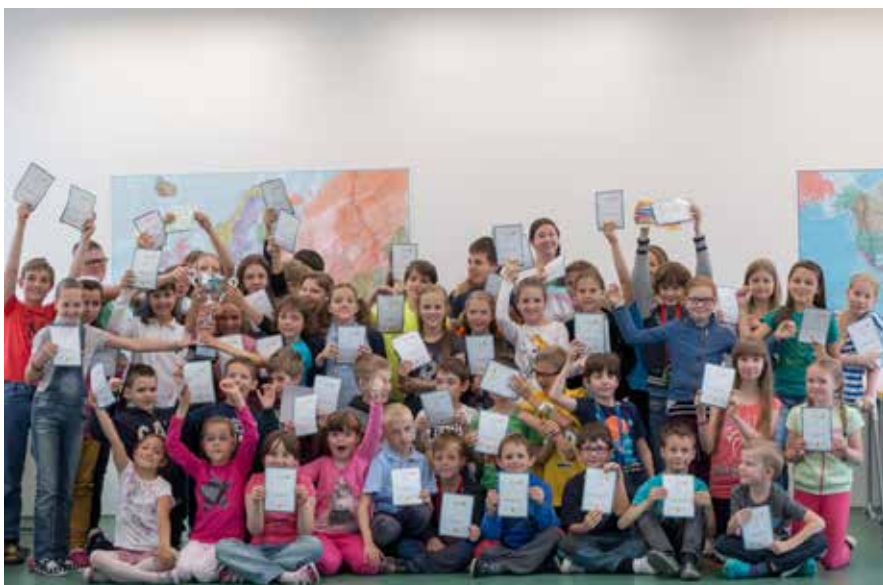
A pak že to nejde!

Všem gratulujeme! text a foto: Jana Chalupová